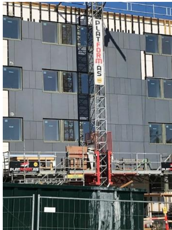
Blok 4 står snart klar til indflytning.

På kanten af sommerferien kan vi konstatere, at der er god fremdrift i byggeprojekterne i Ellebo. Her får du en opdatering.