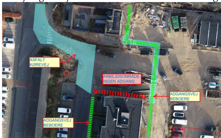
Indkørsel fra Baltorpvej ved Fælleshuset og Blok 4